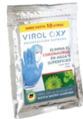
Sobre 100g Rinde hasta 10 litros

Presentación económica ideal para uso residencial