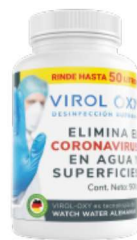
Bote 500g Rinde hasta 50 litros