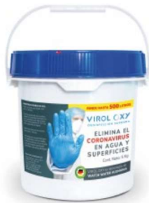
Bote 5 y 6 kg* Rinde hasta 500 litros

Ideal para instituciones, comercios y empresas